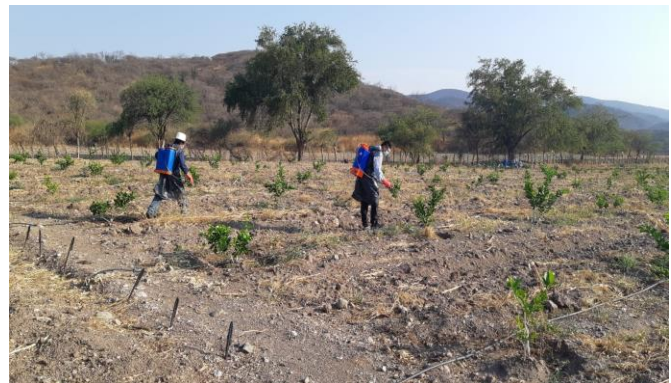
Figura 8. Control cultural en huertos comerciales ante la detección de Leprosis de los

f) Capacitación. Con el propósito de difundir la estrategia operativa de la Campaña, así como la sensibilización hacia los productores sobre la importancia de las enfermedades y adopción de las acciones mediante el establecimiento de AMEFIs, se realizaron 4 Talleres Participativos en los Municipios de Venustiano Carranza y Pantepec, correspondientes a la Región Sierra Norte;