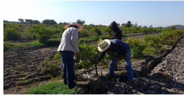
Figura 3. Exploración para detección de síntomas de Leprosis

c) Muestreo. Esta acción se desarrolla en áreas comerciales y zonas urbanas (rutas de muestreo) con la finalidad de detectar psílidos portadores de la bacteria causante de la