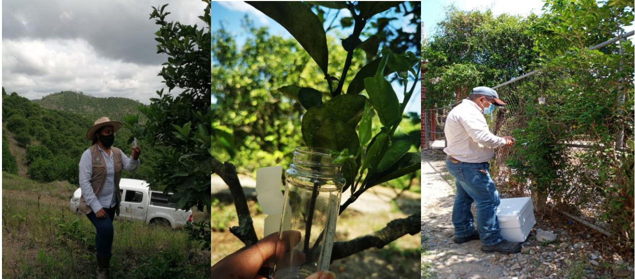
Figura 7. Control biológico del PAC en huertos de traspatio y huertos comerciales

e) Control cultural de Leprosis de los cítricos. Se realizaron las actividades de control cultural de CiLV en huertos comerciales, esta acción se llevó a cabo en una superficie de 4.5 ha de los Municipios de Tlapanala, Xochiltepec y Epatlan, correspondientes a la Región Valle de Atlixco y Matamoros; atendiendo un total de 140 plantas de Limón Persa, beneficiando a 3 productores de cítricos.