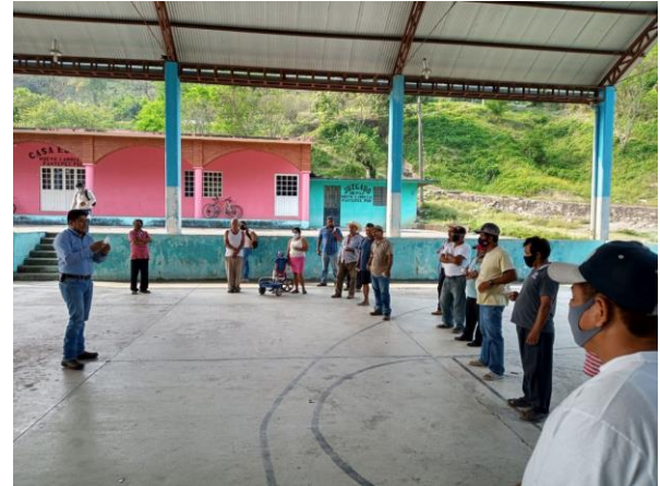
Figura 8. Talleres participativos a productores sobre síntomas de plagas reglamentadas de los cítricos control de diaforina

g) Mapeo. Se llevo a cabo la formación y estandarización de 25.25 hectáreas de cítricos correspondiente a dos polígonos ubicados en los municipios de Ayotoxco de Guerrero y Hueytamalco correspondientes a la Región Sierra Nororiental.