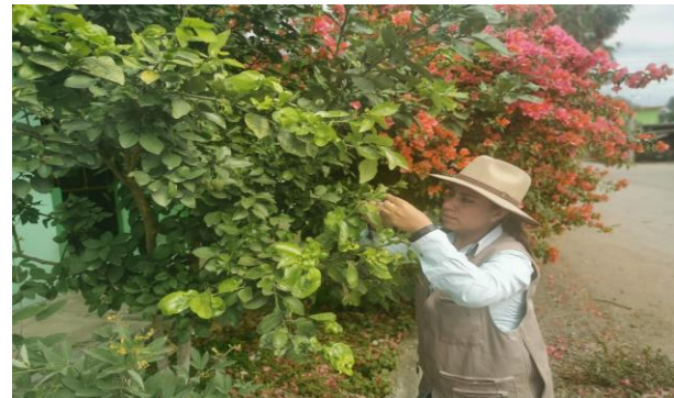
Figura 6. Toma de muestras de psílidos en rutas urbanas

d) Control biológico. Se llevó a cabo la liberación de 151,000 insectos de Tamarixia radiata en 170 huertos comerciales de las Comunidades del Ojital y La Mina, correspondientes al Mpio. de Francisco Z. Mena, cubriendo un total de 377.50 hectáreas.