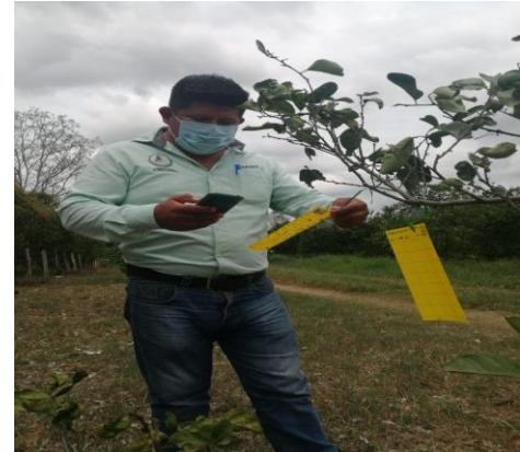
Figura 2. Trampas establecidas y revisadas para el monitoreo del PAC.

El promedio de diaforinas obtenido en el mes de abril fue de 4.23 diaforinas/trampa/mes.