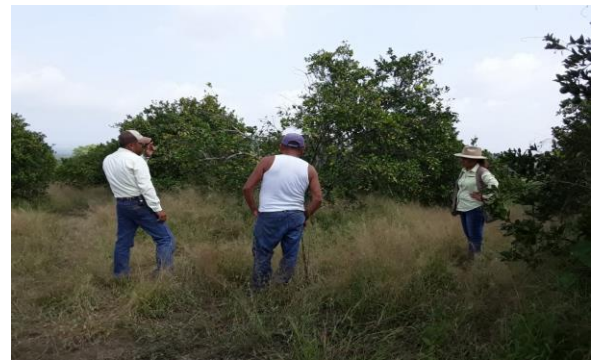
Figura 9. Formación y estandarización de polígonos en huertas de cítricos con la aplicación móvil SIAFEPOL.