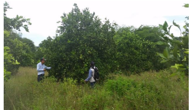
Figura 5. Toma de muestras de psílidos en huertas comerciales